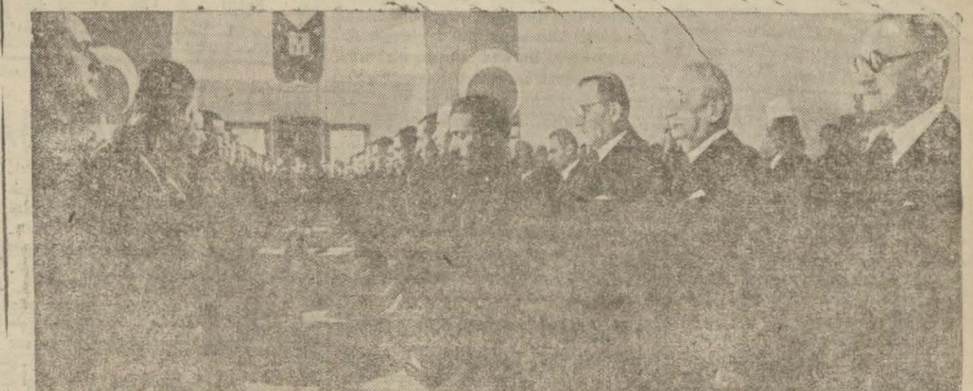
Diploma tevzii merasiminde yedek sübaylarımız and içerlerken. Resimde Meclis Reisi, Başvekil ve Vekiller görülmektedir.